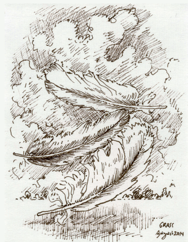
DREI FEDERN von Günter Grass

Unsere vielfältige Arbeit wäre ohne die wertvolle Hilfe verschiedener Förder:innen nicht möglich. Trommeln auch Sie für das Günter Grass-Haus und genießen Sie exklusive Vorteile!